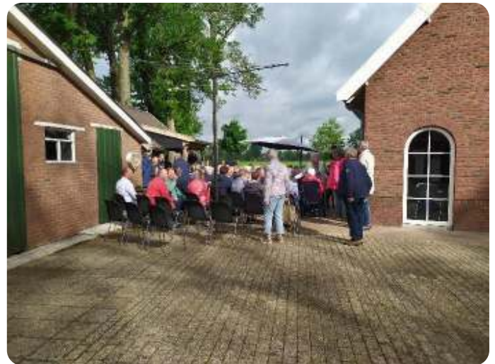
Hemelvaart 2022 op het erf van Te Riet

Langzamerhand druppelen de mensen die met de auto komen dan ook binnen en om 09:30 begint er een open-luchtdienst. Denkt u aan laagjes kleding tijdens de dienst, het kan begin mei nog best fris zijn . Na de kerkdienst is er dan (weer) koffie en een gezellige nazit/-sta.