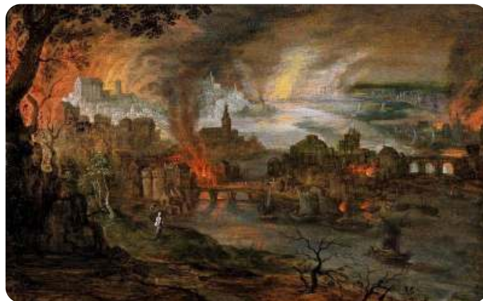
Pieter Schoubroeck - De verwoesting van Sodom en Gomorra

aan. De zon komt net op, de verschrikking is voor hen voorbij. Voor Sodom en Gomorra niet, zwavel en vuur vallen uit de hemel en de steden gaan in vlammen op. Toch is hun ellende niet helemaal voorbij, dat zien we straks. Twee maal staat er dat JHWH zelf de vuurregen veroorzaakt. Het is dus toch niet de engel die dit onheil aanricht.