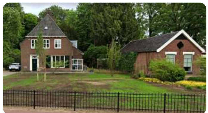
Hier speelde de wateroverlast zich af