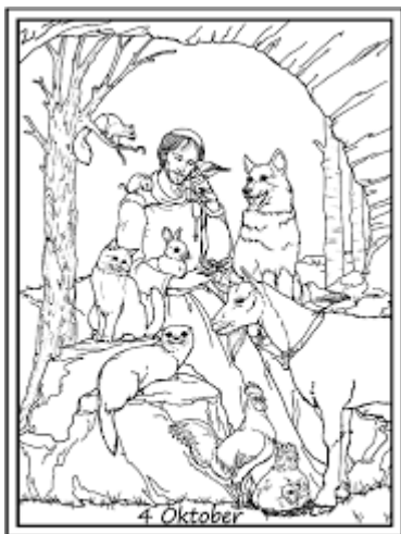
Sterfdag Franciscus van Assisi en Dierendag