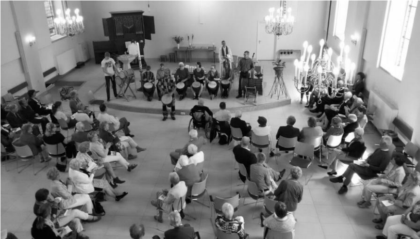
Djembé spelen tijdens de dienst