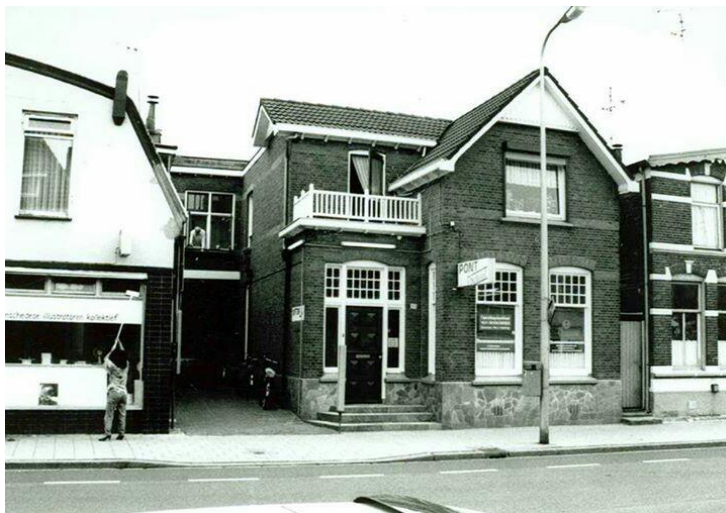
De Pontschool aan de Kuipersdijk, Enschede

In de avonduren volgde ze in de periode 1979 - 1985 verschillende cursussen (typen, steno, handelscorrespondentie, notuleren) aan de z.g. 'Pontschool'. Dat was van 1949 - 2000 een particuliere school waar je allerlei administratieve opleidingen kon volgen.