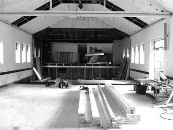
De situatie op 29 juni

We zijn de afgelopen jaren flink bezig geweest: de verbouw van de kerk in 2006, de opknapbeurt voor de pastorie in 2013, de verbouw van het voorportaal van het Verenigingsgebouw met de aanbouw van een keuken in 2015, en nu de verbouw van de zaal van het verenigingsgebouw. De PKN Usselo verklaren we dan ook hierbij, wat betreft het vastgoed, voor toekomstbestendig.