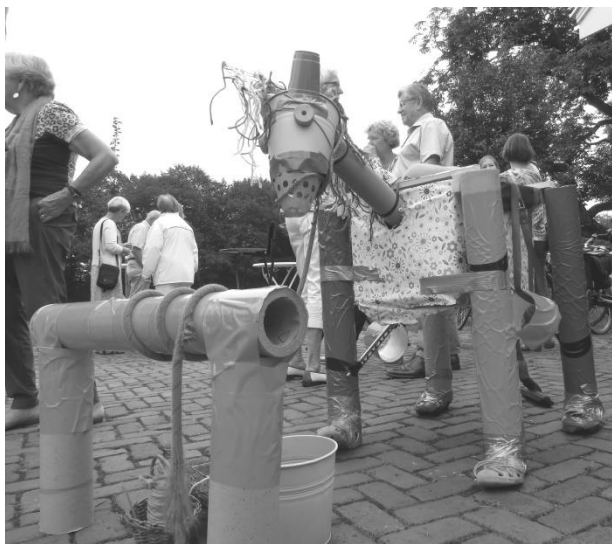
Door de kinderen gemaakt