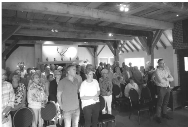
Tijdens de kerkdienst