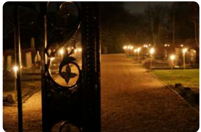
Lichtjesavond begraafplaats Usselo