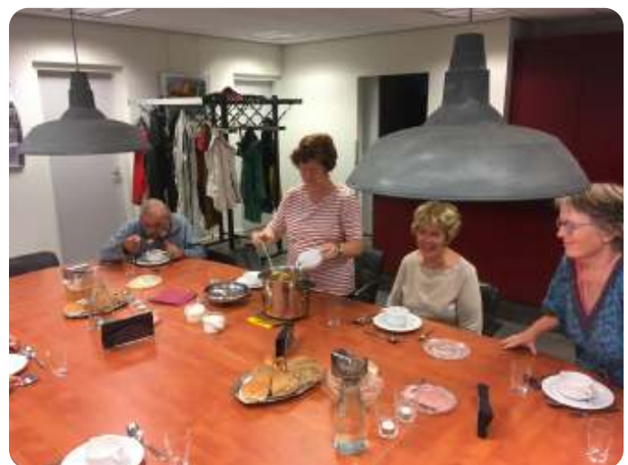
het tafelgesprek van september vorig jaar