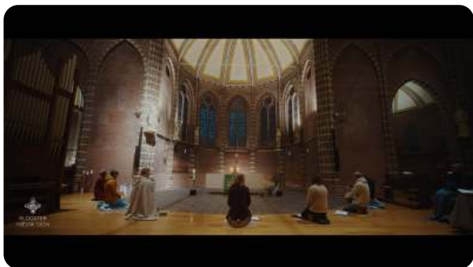
Deel van de kerk waar de getijdendiensten worden gehouden

De vieringen maakten diepe indruk op me. Later ging ik nog naar andere kloosters. Geregeld bij de Dominicanen in Huissen waar je ook cursussen kon volgen via het DAC (Dominicaans Activiteiten Centrum). Het was steeds weer je accu opladen, rust en bezinning. Nodig in het hectische leven van werk in de hulpverlening en zorg voor het gezin. Dit jaar was er op de data die ik wou geen plek in Huissen, ging ik verder zoeken en kwam uit bij Nieuw Sion, op dezelfde plek in Diepenveen. Twee nachten geboekt. Geen programma, best wel spannend want ik ben niet zo'n held in het alleen en op mezelf zijn. Maar doordat je 4x per dag mee kunt doen aan de gebedstijden heb je al een ritme. Bij het ontbijt en het avondeten ontmoet je andere gasten die openstaan voor een gesprek. En je komt eindelijk toe aan een boek lezen. De dagen vlogen om en je bent echt even in een andere wereld.