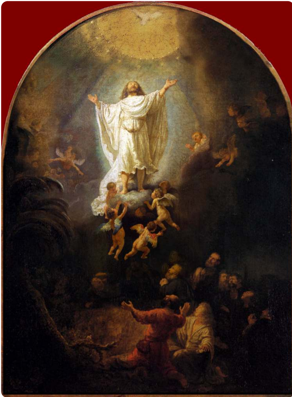
olieverf op doek (93 x 69 cm) — 1636 Museum Alte Pinakothek, München

Na zijn opstanding, met Pasen, trok Jezus nog een tijdje op met zijn volgelingen. Veertig dagen na zijn opstanding nam hij afscheid en steeg hij op naar de hemel. Volgens Marcus kreeg hij daar een plek rechts van God.