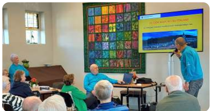
uitleg over de wensambulance