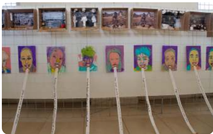
kunstwerk school Usselo