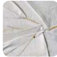
Kreuken, vouwen, rimpels

In de stof zitten kreuken, vouwen en rimpels zoals in ons leven. Ook zijn er delen aan elkaar gevoegd en scheuren met chirurgische precisie hersteld. Het hecht draad staat voor heling en toekomst.