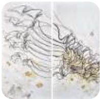
Uitgangspunt: de voet

De voet is het uitgangspunt van de hongerdoek. Onze voeten dragen ons en bieden stabiliteit. Als er iets aan onze voeten mankeert zijn we hulpeloos en kunnen we geen kant op. Mensen zijn door God geschapen om rechtop te staan en onze levensweg te gaan in solidariteit met onze medemens en de rest van de schepping.