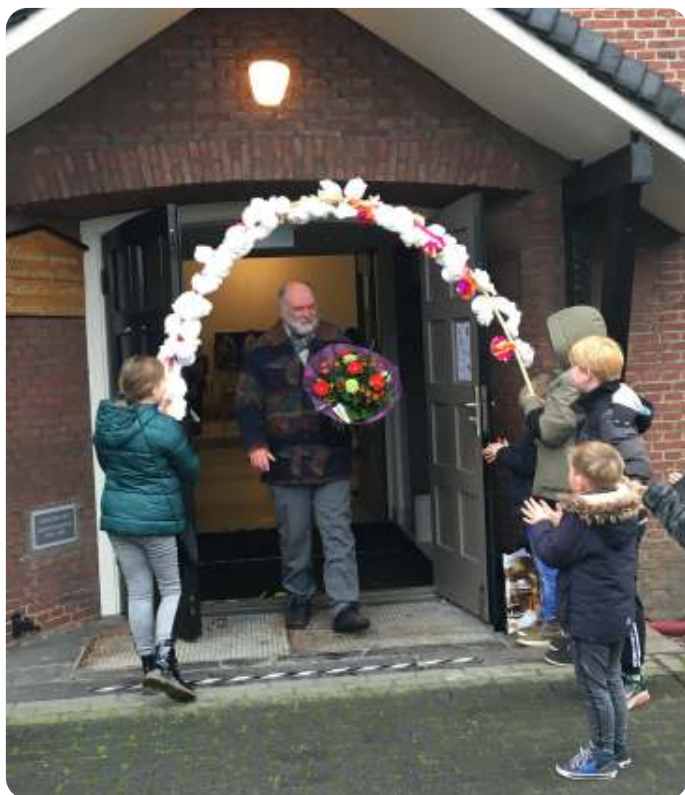
"Petér, Petér, Petér ..."