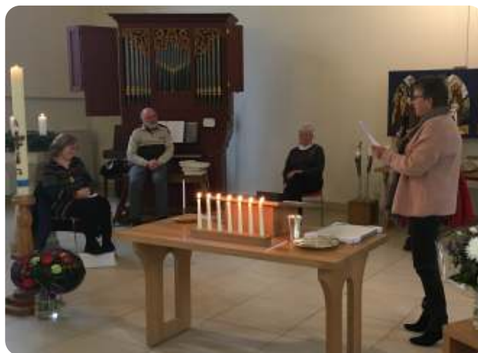
Toespraak en cadautjes

Onze Protestantse Gemeente bood hem een enveloppe met inhoud en een bos bloemen aan. Helaas moesten we het vanwege de Corona sober laten verlopen, dus de borrel om te toosten moeten we nog even tegoed houden.