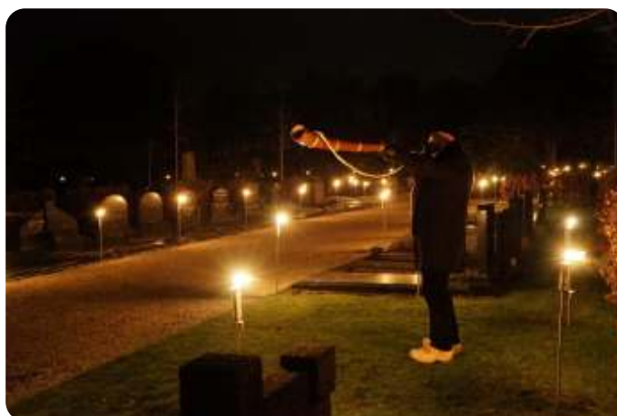
een lichtjesavond vóór Coronatijd