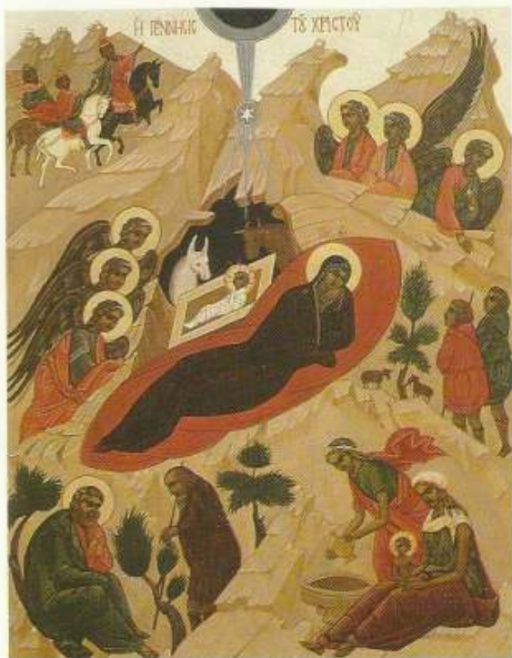
"Er schoten drie stralen dooreen....."

Het feest van de Geboorte van Christus is in het westen ontstaan, in de eerste helft van de vierde eeuw om de goddelijkheid - en menselijkheid - in Christus te onderstrepen in aansluiting op het Concilie van Nicea (325). In de loop van de geschiedenis heeft het feest in het westen de schilderachtige nativiteit ontwikkeld die we nu kennen. Het oosten nam het feest over, ofschoon daar het feest van de Doop in de Jordaan meer aandacht kreeg (zie pagina 8). Het feest van 25 december heeft in het oosten zijn oorspronkelijk karakter behouden: de Verschijning van de Zoon in de wereld, zijn geboorte in een kribbe als in een graf en de aanbidding van de herders en de wijzen. Dit zien we allemaal op de ikoon afgebeeld, wederom sterk bepaald door de apokriefe verhalen.