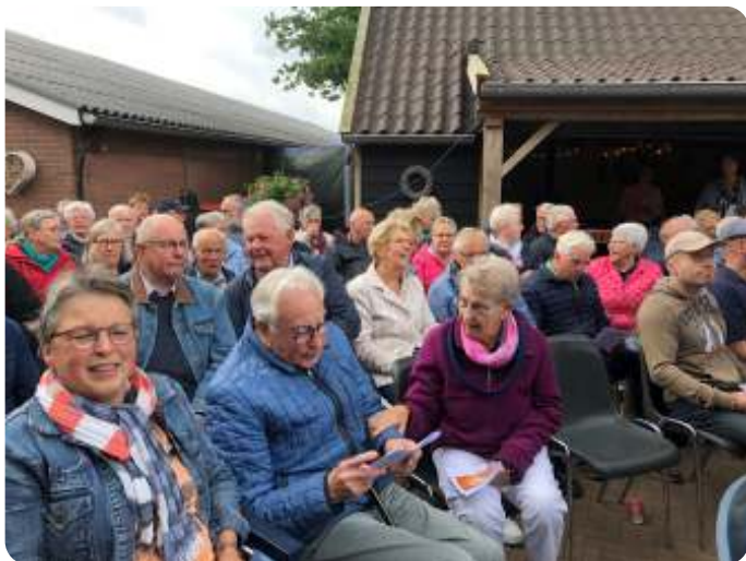
Usseloërs prominent aanwezig

Iedereen werd verwelkomd met lekkere koffie op het erf van de fam. ter Riet in het buitengebied van Buurse. De Weergoden waren met ons, en met z'n allen hebben we genoten van deze dienst in de open lucht.