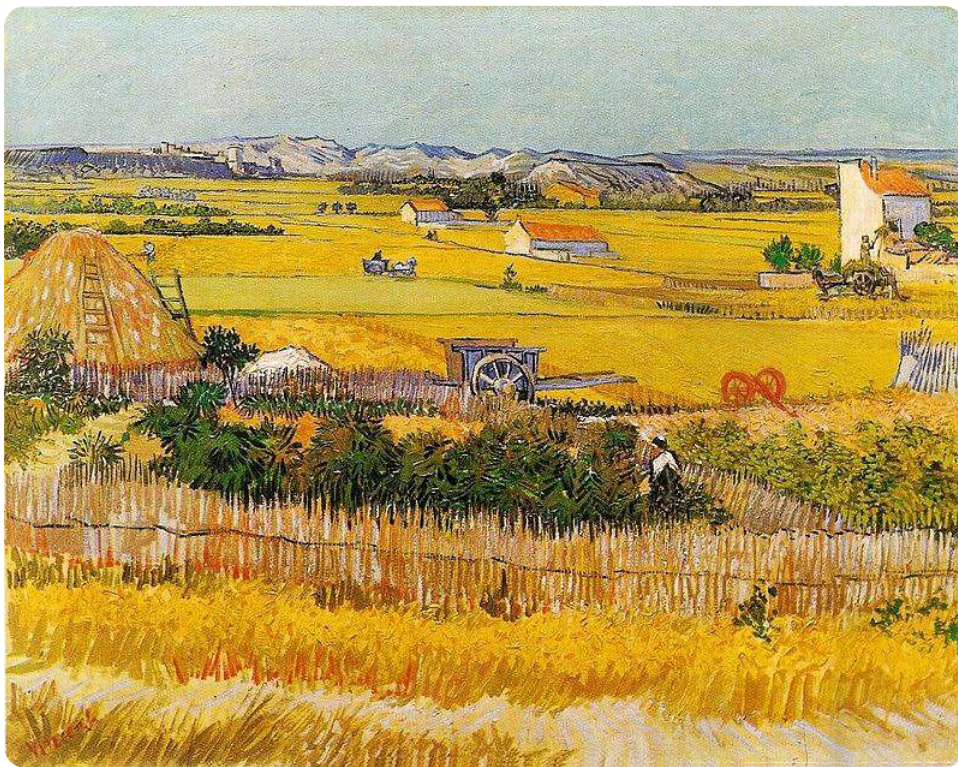
Vincent van Gogh - De Oogst

Vincent van Gogh (1853 - 1890), Arles, juni 1888