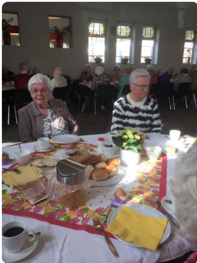
Impressie van de Open Venster Middag