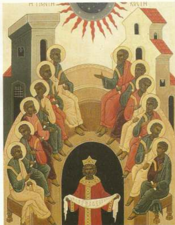
Het Pinksterfeest werd al gevierd in Jeruzalem sinds de vierde eeuw. Allereerst was het de viering van de nederdaling van de Heilige Geest over de apostelen. Vanwege de dogmatische strijd omtrent de persoon van Jezus - die vooral in het oosten de gemoederen hoog deed opslaan - werd deze verschijning van de Geest beschouwd als de voltooiing van de openbaring van de drieëne God. Zo werd het in het oosten vooral een feest van de Drieëneheid: Triniteitszondag. De viering van de geesteszending over de apostelen werd naar de maandag verschoven. De icoon tekent dit tweede aspect. De liturgische teksten benadrukken beide.

Het kan zijn dat deze Drieklank bij u op de mat ploft als Pinksteren al voorbij is. Maar dan is Pinksteren toch nog maar zo kort geleden dat deze icoon, geschilderd door Els Steenberghe voor de Mariakerk van Oosterhout, nog wel actueel is. Het icoon maakt deel uit van een serie van 12 die het hele jaar omvat.