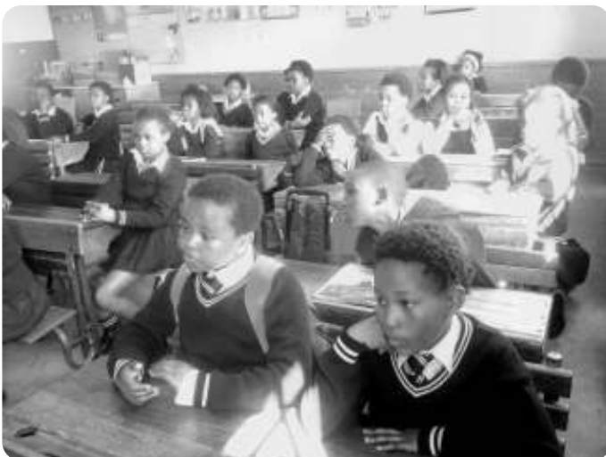
Een Maryano schoolklas

'Reading clubs' opzetten om de leerlingen liefde voor het boek bij te brengen. Hiervoor is grote belangstelling.