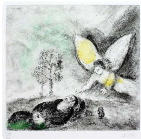
Elia onder een struik en een engel

Raven hebben je te eten gegeven, water was er voor jou; en nu geef je op. Gelukkig staan er verhalen in de bijbel die ineens dichterbij je eigen