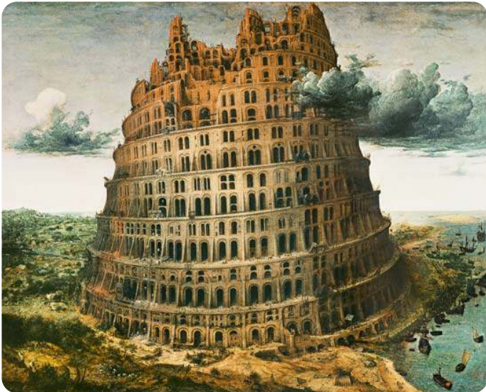
Pieter Brueghel - De toren van Babel

Hij daalt af en maakt het opklimmen onmogelijk. De mensen denken dat ze ver in de hoogte zijn gevorderd, maar door af te dalen laat God zien dat ze er nog lang niet zijn. Je ziet het voor je: mensen spreken tegen elkaar, maar begrijpen elkaar niet meer. Er is sprake van een Babylonische spraakverwarring.