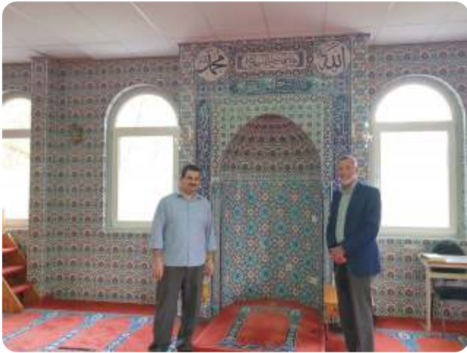
Olaf op bezoek in de moskee van Haaksbergen

het niet opeten vanwege een teveel aan suikers. We zullen in september de gespreksgroep starten. Voor de imam was het een verrassing en voor mij was het ook een verrassing. Een blaadje aan een boom, een bloemetje aan de kastanjeboom. Je moet het wel zien en je gelijk realiseren, dat het op je weg komt. Voor mij betekent Pinksteren: "uit het onverwachte komt nieuw leven". Hoe het verder zal lopen weten we niet, maar de ontmoeting is ontstaan. Wellicht iets voor een nieuwe toekomst, waar mensen elkaar kunnen leren verstaan van hart tot hart.