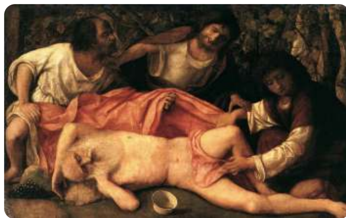
De dronkenschap van Noach, door Giovanni Bellini

Noach heeft drie zonen, Sem, Cham en Jafeth. We lezen dan het verhaal over Noach die tot de ontdekking komt dat je van gistende druiven een heerlijke drank kunt maken. Hij geniet van de wijn, maar weet niet dat deze drank een neveneffect heeft. Daar komt hij gauw genoeg achter, want hij wordt dronken. In die beschamende toestand treft Cham hem aan. Die vindt het wel leuk en rent naar zijn broers om hen deelgenoot te maken van deze lachwekkende situatie. Sem en Jafeth verliezen de achting voor hun vader niet en bedekken hem zonder hem te willen zien.