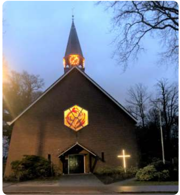
Het Kruis bij de Kinderpassion