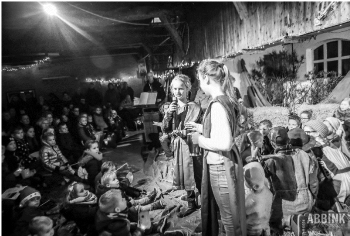
Impressie van eerdere opvoering kerstspel