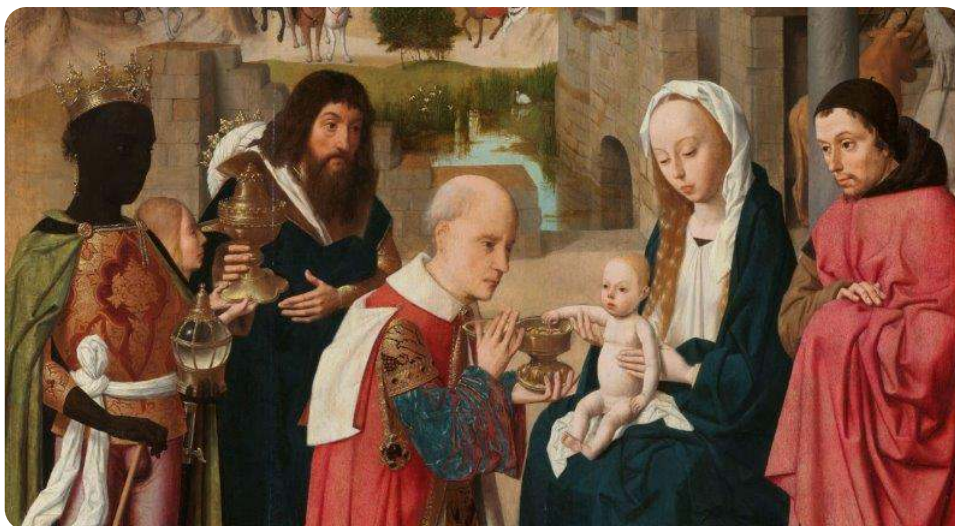
De aanbidding van de koningen, Geertgen tot Sint Jans, ca. 1480 - ca. 1485