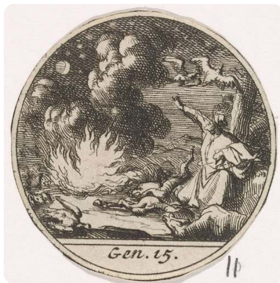
Verbond tussen Abraham en Goed, Jan Luyken, ca. 1700, Rijksmuseum

God zegt nog meer, hij wil een verbond sluiten met Abram en hij zal zijn nageslacht zeer talrijk maken. Het woord verbond, beriet, is een kernwoord in dit hoofdstuk, dertien keer komt het hier voor. Het is de relatie die God aangaat met Abram en Sara en die ook geldt voor al hun nakomelingen. Het getuigt van Gods liefde die nooit zal eindigen. Jonathan Sachs citeert in dit verband Lev. 26, 44-45: "Ik zal mijn verbond met hen niet verbreken...". Lees het maar eens na.