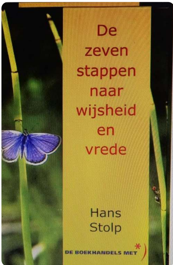
Het boekje waarin bovenstaand gedicht

Liefde is God. Want uit God werd zij geboren En tot God brengt zij alles wat leeft. Wie de liefde heeft, leeft God.