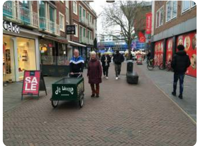
Op weg naar de markt

Dit vanuit de gedachte dat het zonde is om voedsel weg te gooien dat niet meer verhandeld kan worden. En deze gedachte maakt bovendien deel uit van de kringloop-filosofie van De Wonne. Dat medewerkers en bewoners van De Wonne dan een gratis maaltijd hebben is daarbij meegenomen.