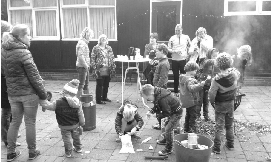
Bij het voormalige kerkje aan de Kwinkelerweg