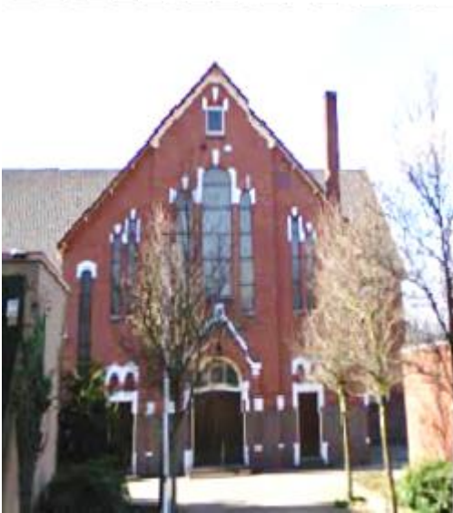
Vrijgemaakt gereformeerde kerk Haaksbergerstraat

Anneke Klos werd in 1944 geboren in Enschede in een gereformeerd gezin. Hoewel zij daar toen geen weet van had was het een turbulente tijd. De tweede wereldoorlog was ook in Enschede nog volop realiteit. En binnen de gereformeerde kerk woedde in dat jaar een andere oorlog: de Vrijmaking. In Enschede gingen - anders dan op de meeste plaatsen elders in het land - verreweg de meeste leden van de gereformeerde kerk mee met die Vrijmaking. Van de ruim 5000 gereformeerden waren dat er 4200. Zodat er ongeveer 900 leden in de (synodaal-) gereformeerde kerk overbleven. Kerkgebouwen en -goederen gingen naar de Vrijgemaakten, de 'Synodalen' moesten opnieuw beginnen. Dat deden ze o.a. door de bouw van de Deta-kerk in 1950. U kunt hier meer over lezen als u de digitale versie van deze aflevering van Drieklank raadpleegt en dan hier op klikt. Die website heb ik zelf ook gebruikt voor deze informatie over de Vrijmaking in Enschede.