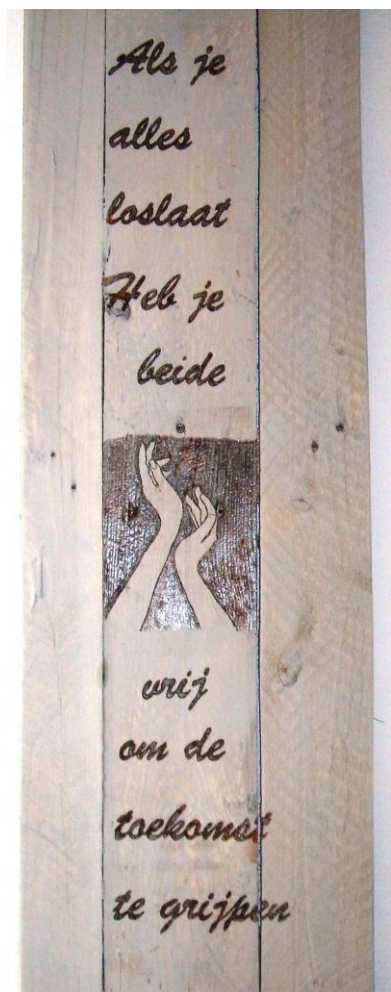
Stuk hout met tekst

Wij willen hierbij als bewoners en personeel van de Kortdurende Opvang van het Leger des Heils u hartelijk bedanken voor uw bij- Drage.