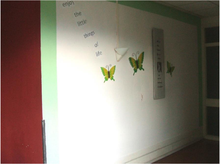
De opgeknapte muur